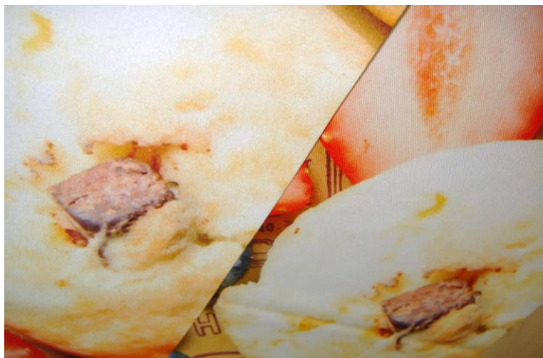
マイクロファイバー(左)、ピーチスキン(右)の生地の違い

写真では少しわかりづらいですが… マイクロファイバー生地は少し毛足がありますが、繊維が細かいので印刷が綺麗にのります。 シングルスエード、サテン、ピーチスキン生地より柔らかい風合いに仕上がります。