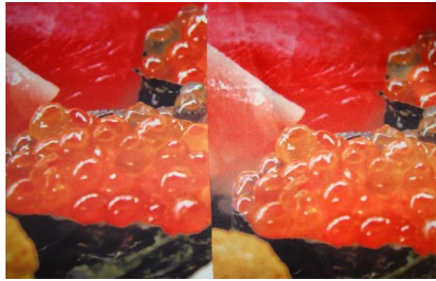
シングルスエード(左)とサテン(右)の生地の違い 2

同じデザインを印刷したのでシングルスエード生地とサテン生地の違いを載せました。 サテン生地は光沢感が他生地よりも目立ち、印刷がはっきりのつても光を反射してしまうこともあります。 また生地がスエードよりも薄地なため、遮光性が低く光を通しやすいのも特徴です。