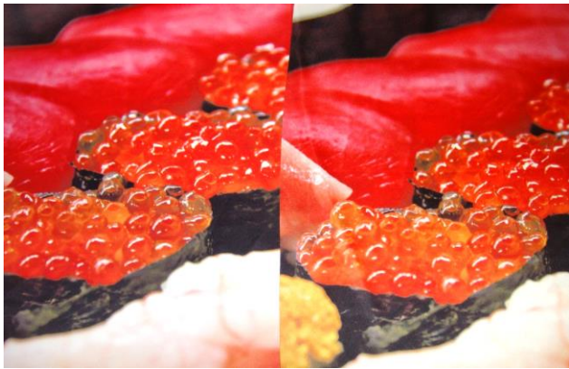
シングルスエード(左)とサテン(右)の生地の違い